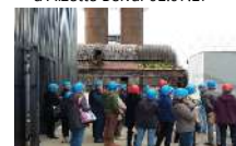
Visite journées européennes du patrimoine 16.09.17