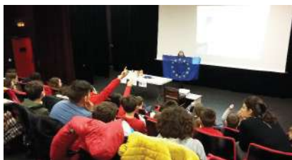
Intervention Europe Direct Lorraine le 28.02.17

TOURISME / CULTURE. Pour la 3ème année consécutive, des activités transfrontalières ont été proposées pour les journées européennes du patrimoine en France et au Luxembourg. Le GECT Alzette Belval et les acteurs du tourisme et de la culture ont réalisé un flyer recensant les activités proposées sur la période. Deux circuits transfrontaliers ont été organisés permettant de faire visiter de nombreux sites culturels d'Alzette Belval (50 participants). Parallèlement, un challenge du patrimoine transfrontalier était proposé aux habitants du 16.09.2017 au 08.10.2017, leur permettant de visiter 5 des 9 sites partenaires pour gagner un cadeau. La participation était bonne.