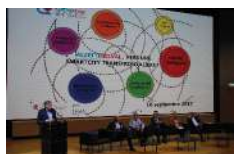
Conférence Smartcity 16.09.17