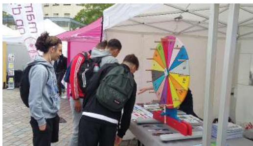
Roue de la fortune d'Alzette Belval à l'occasion du passage du tour de France

L'accueil des instances de la Mission Opérationnelle Transfrontalière (MOT) les 15 et 16 mars 2017, et l'organisation de la conférence « GECT Alzette Belval, vers une smartcity transfrontalière ? » le 16 septembre 2017 ont permis de repositionner le GECT Alzette Belval et ses projets auprès des autres structures de coopération transfrontalière en Europe, des institutions locales, des acteurs privés,... avec lesquels le GECT n'a pas forcément l'habitude de travailler (BEI, LISER, LIST...). A l'issue de la conférence SMARTCITY, le GECT Alzette Belval a apporté son soutien à la candidature portée par Luxmobility pour un CIVINET luxembourgeois avec un focus sur les problématiques transfrontalières en octobre 2017. Il a été identifié comme un référent local et un territoire d'expérimentation. Le GECT était également présent lors des conférences organisées par la MOT à Bruxelles à l'occasion des 20 ans de l'association les 30 novembre et 1er décembre.