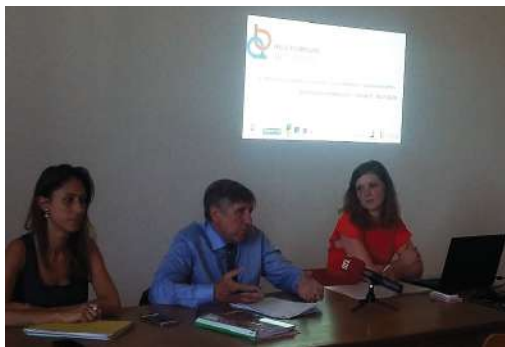
Conférence de presse suite à l'adoption de la nouvelle stratégie 26.06.2017

Les membres du bureau du GECT Alzette Belval se sont accordés sur une révision participative du document, afin que la deuxième période d'orientations stratégiques « travailler ensemble pour faire l'agglomération transfrontalière » soit élaborée en collaboration avec les membres, les institutions partenaires et les habitants d'Alzette Belval. Aussi, le bilan de la première période et une première proposition de document révisé ont d'abord été envoyés aux membres du GECT Alzette Belval, ainsi qu'aux institutions partenaires (EPA Alzette Belval, AGORA, PROSUD, AGAPE, ...) [dec. 16 - fév. 17]. Dans un deuxième temps, les habitants du territoire ont été invités à donner leur avis sur les thématiques abordées : mobilité, environnement, vie quotidienne, rencontres entre les habitants, ... par une consultation publique via le site internet du GECT et relayée par la presse (article et conférence de presse) [avr. - mai 17]. Plusieurs personnes ont répondu au questionnaire, ce qui a permis au GECT de recueillir un éclairage différent de son travail.