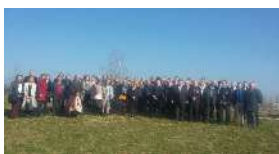
Instances MOT 15-16.03.17

Le GECT Alzette Belval a été également activement associé aux travaux du groupe intergouvernemental franco-luxembourgeois pour les obstacles à la coopération transfrontalière. Parallèlement, l'année 2017 a contribué au rayonnement et la promotion de l'agglomération transfrontalière auprès de ses habitants, notamment par la participation du GECT au village du tour lors du passage du tour de France le 3 juillet 2017. Une « roue de la fortune d'Alzette Belval » était proposée aux passants, permettant de tester leurs connaissances sur le territoire et de gagner un cadeau local (env. 190 participants). De plus, à l'occasion du Mois de l'Europe organisé par la Région Grand Est, le GECT a lancé la rédaction ouverte d'un livret transfrontalier « Alzette Belval, une frontière ? » afin de recueillir les impressions des habitants sur le territoire et leur perception de la frontière.