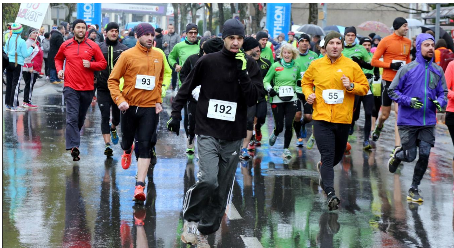
Au total, 213 concurrents se sont élancés dans les rues de Villerupt pour la Transfrontalière. L'épreuve de 15 km proposait aux participants de passer par le Luxembourg et Audun-le-Tiche, entre autres.

Les participants ont d'ailleurs apprécié l'organisation qui, pour le coup, avait mobilisé une cinquantaine de bénévoles. Sur l'aire d'arrivée, l'atmosphère était à la fête grâce aux reprises de chansons célèbres effectuées par Los Chicanos. Avant le départ, un échauffement en Zumba avait été proposé par Z-Dance. Comme pour