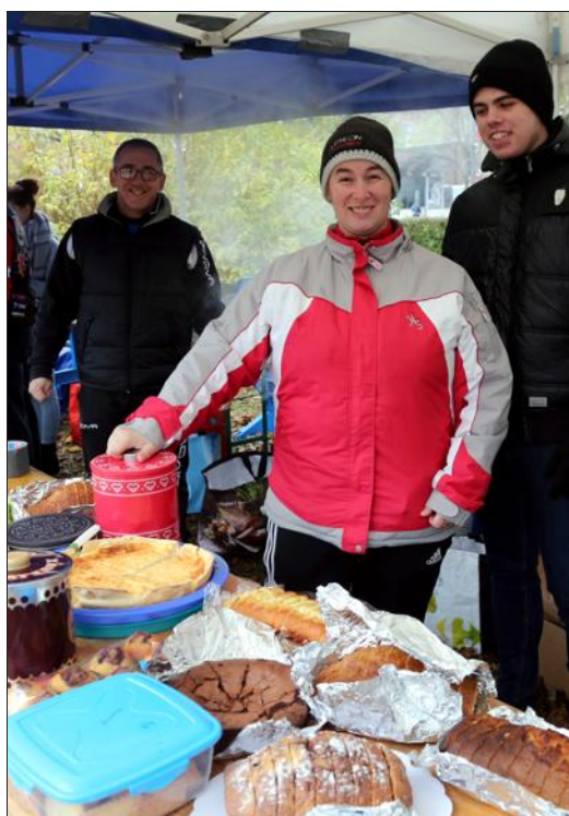
Après l'effort, le réconfort ! Les bénévoles, en grande partie du TGV54, proposaient de quoi se ressourcer après la course.